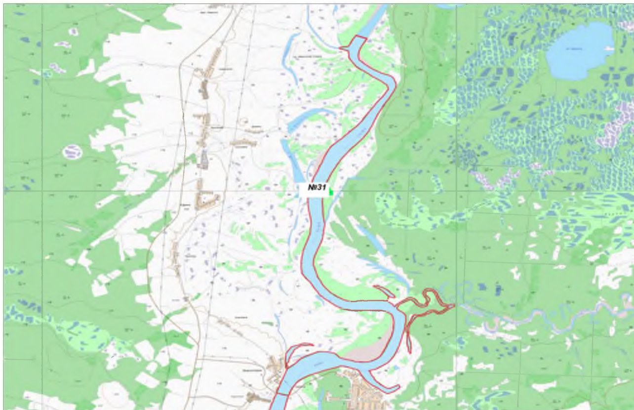
Схема рыбопромыслового участка № 31

Горьковское водохранилище река Унжа от д. Красногорье (63 км) линия между точками с координатами 43^{\circ}41'55'' в.д. 57^{\circ}42'45'' с.ш. и точкой 43^{\circ}42'09'' в.д. 57^{\circ}42'45'' с.ш. до д. Ивакинская старка (74,5 км), линия между точками с координатами 43^{\circ}43'22'' в.д. 57^{\circ}46'54'' с.ш. и точкой 43^{\circ}43'08'' в.д. 57^{\circ}46'54'' с.ш., включая акваторию заводов, островов, пойменных озер, устье р. Белый Лух на 500 м.