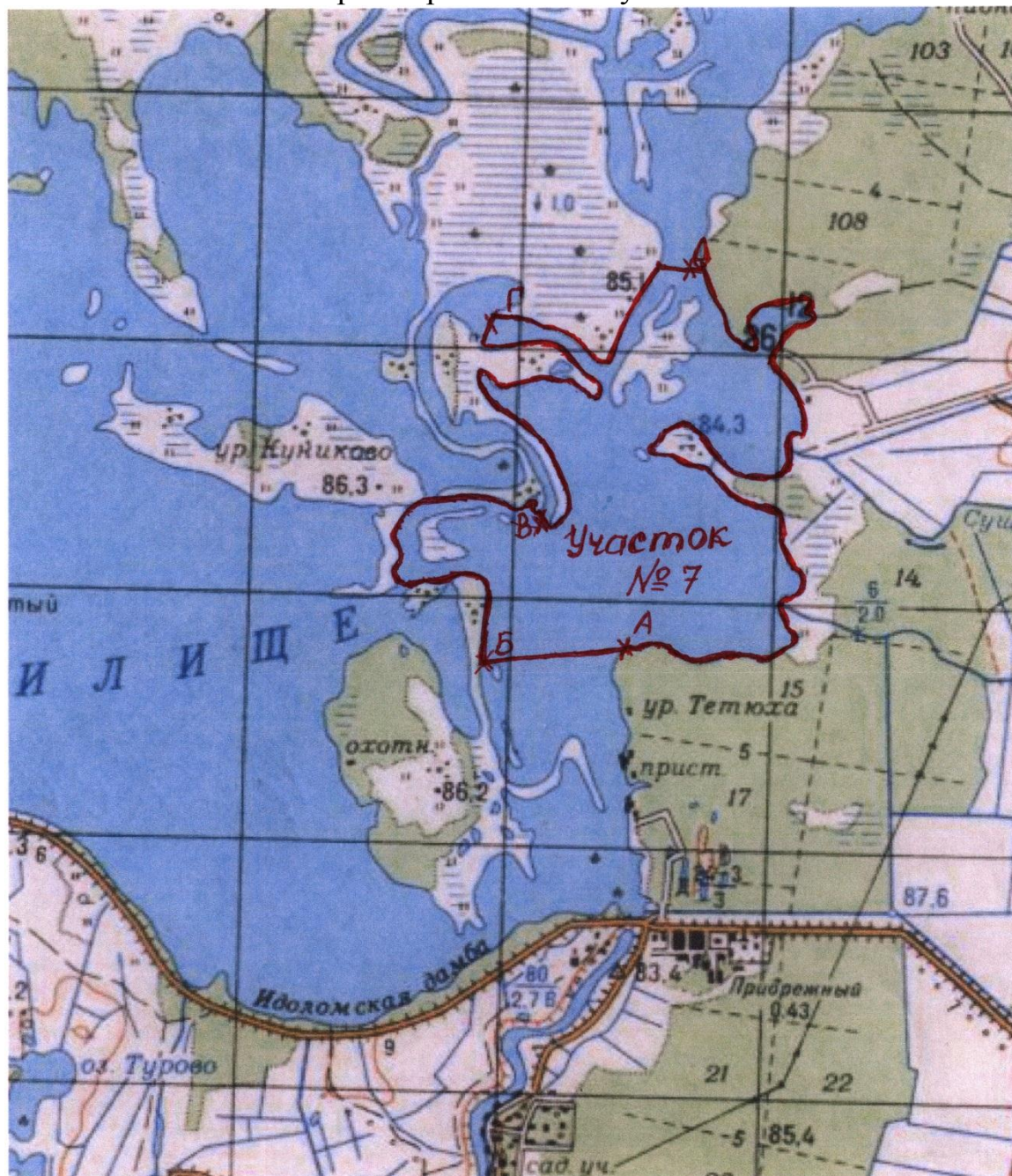
Схема рыбопромыслового участка № 7

Горьковское водохранилище Костромской разлив Lent'yevskiy поймой в границах: от крайней северо-западной точки мыса "материкового" берега точка с координатами 40^{\circ}52'7'' в.д. 57^{\circ}55'2,1'' с.ш. до о. Заезкино, 40^{\circ}51'3'' в.д. 57^{\circ}54'58'' , включая старое русло реки Костромы до "Широкого" точка с координатами 40^{\circ}51'26,5'' в.д. 57^{\circ}55'31'' с.ш. Далее старое русло реки Костромы от точки с координатами 40^{\circ}51'5,7'' в.д. 57^{\circ}56'23,2'' с.ш. Шувалов омут до